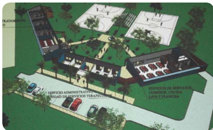
Maqueta del nuevo Centro de Nicaragua

Esta iniciativa es resultado de un acuerdo de colaboración entre la ONUDD, el Ministerio de Salud de Nicaragua a través del CNLCD (Consejo Nacional de Lucha Contra la Droga) y la Fundación Solidaridad del Henares Proyecto Hombre de Castilla-La Mancha.